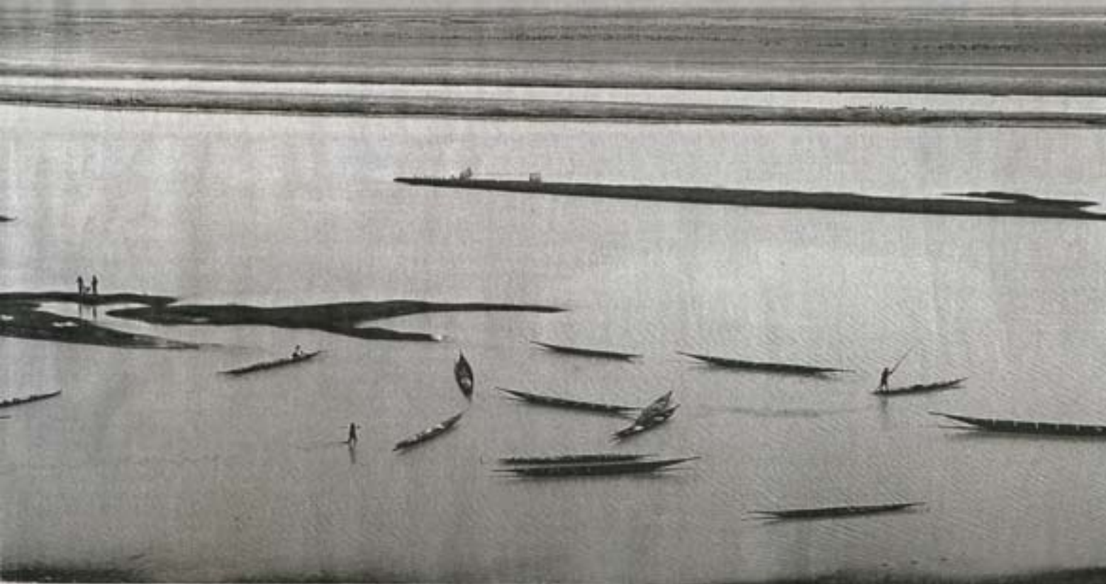
Photographies de Bernard Descamps. De gauche à droite, Fils de pêcheur , Manakara, Madagascar, 1999; Fleuve Niger, embouchure du lac Débo , Mali, 1997 et Pygmées Aka , Centrafrique, 1996.